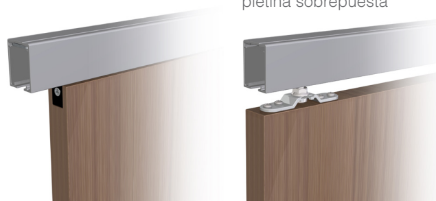
Instalación con pletina sobrepuesta

La familia Roller Timber incorpora un nuevo freno retenedor con las siguientes características: